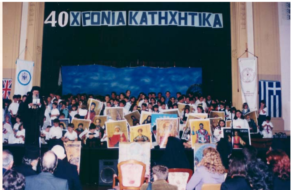
Left. Concert program for the occasion for the anniversary of 30 years of Sunday Schools held at Sydney Town Hall, November 24, 1985. Right. November 23, 1996. Concert celebrating 40 Years of Sunday Schools, held at Marrickville Town Hall in the presence of His Holiness Ecumenical Patriarch Bartholomew I.