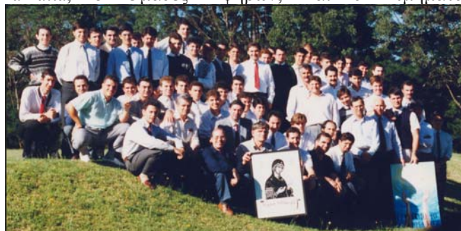
Τα μέλη της Χριστιανικής Ενώσεως, στο Mittagong

Η Ένωση τώρα αποτελείται από : - Τρεις Κύκλους ανδρών και νέων, τρεις Κύκλους γυναικών και νεανίδων, ένα Κύκλο κυριών στο Parramatta, 8 Ομάδες Εφήβων, και 62 τμήματα