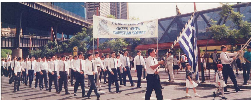
Τα μέλη της Χριστιανικής Ενώσεως λαμβάνουν μέρος στην Εθνική παρέλαση προς το Sydney Opera House

Περιγράφοντας τις παραπάνω δραστηριότητες της Ενώσεως, αισθανόμαστε υπόχρεοι να αναφέρουμε ότι τίποτε δεν θα ήταν δυνατόν χωρίς την συμπαράσταση και πνευματική κατεύθυνση των μακαριστών Ιεραρχών της Εκκλησίας, κ.κ. Θεοφυλάκτου και κ.κ. Ιεζεκιήλ.