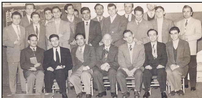
Τα μέλη της Χριστιανικής Ενώσεως, 1956

Οι ψυχές όλων μας γέμισαν με μια πρωτόγνωρη ειρήνη (Συνέχεια στην 6η σελίδα)