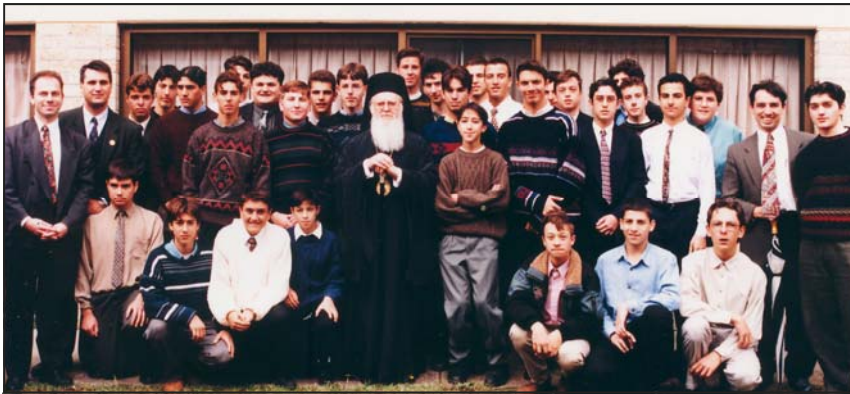
Ομαδόπουλα του Σύνδνεϋ με τον Οικουμενικό Πατριάρχη κ.κ. Βαρθολομαίο, κατά την επίσκεψή του στις 22 Νοεμβρίου, 1996