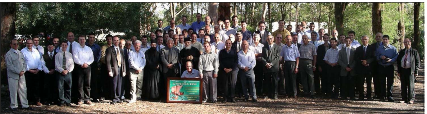
Τα μέλη της Χριστιανικής Ενώσεως, Ιανουάριος 2004

Τέλος, ευχαριστούμε με ευγνωμοσύνη τον Κύριο, που μας στήριξε όλα αυτά τα χρόνια, και τα λίγα έργα που κάναμε του τα προσφέρουμε με άκρα ταπείνωση, ώστε Εκείνος να τα αγιάσει προς δόξα του Ονόματός Του και της Εκκλησίας Του.