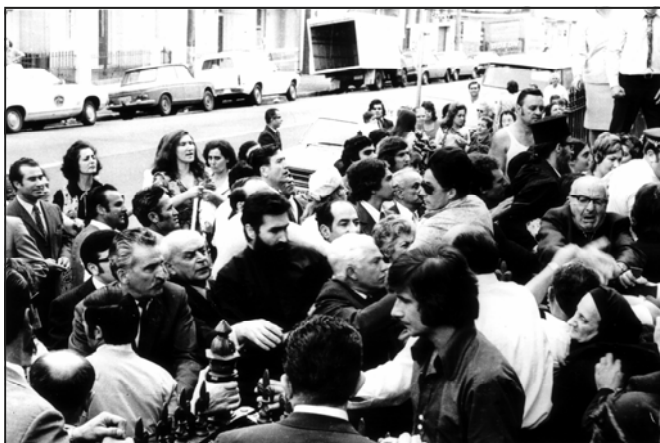
Members of the Greek Orthodox Christian Society (Enosis) and Ladies Friendly Society (Kyklos) together with other faithful who were defending St Sophia in April 1974 against the intrusion of non-canonical priests

Η διάδοση του θείου λόγου προχωρεί με πολύ επιτυχία. Ακολουθεί η ίδρυση Κατηχητικών Σχολείων, επισκέψεις συμπατριωτών στα νοσοκομεία, δανειστική βιβλιοθήκη, ομάδες για μεγαλύτερα παιδιά, εξορμήσεις στα ελληνικά σπίτια στο Paddington και στο Redfern, για τόνωση του χριστιανικού φρονήματος και δωρεάν βιβλία και περιοδικά. Και το πιο σπουδαίο, τα μέλη συνεχώς αυξάνονται καθώς το έργο ξαπλώνεται στην Ελληνική παροικία.